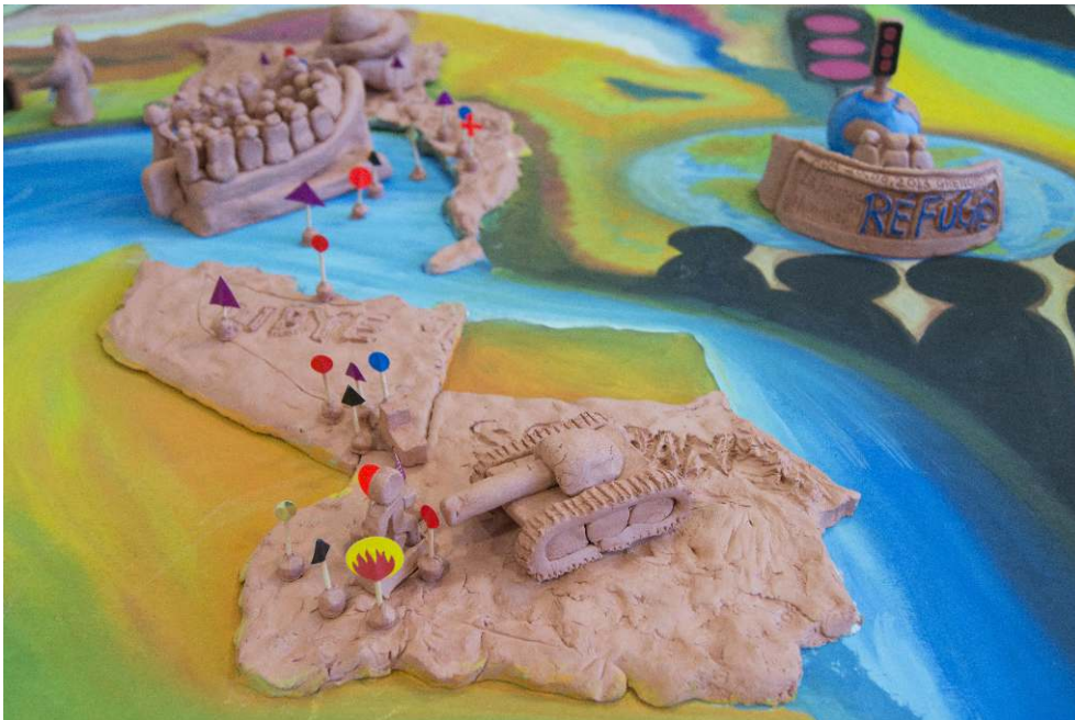
Figure 8. « The world is stopping us/Le monde nous empêche d'avancer ». Vue 2

Carte réalisée par Gladeema Nasruddin, argile, bois, peinture, Grenoble, atelier de cartographie, juin 2013, photographies : Mabeye Deme