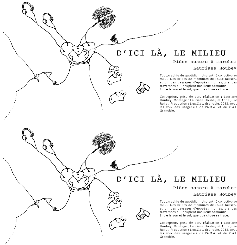
Figure 5. « D'ici là le milieu »

Texte et dessin de Lauriane Houbey, à partir des ateliers de cartographie, Grenoble, septembre 2013.