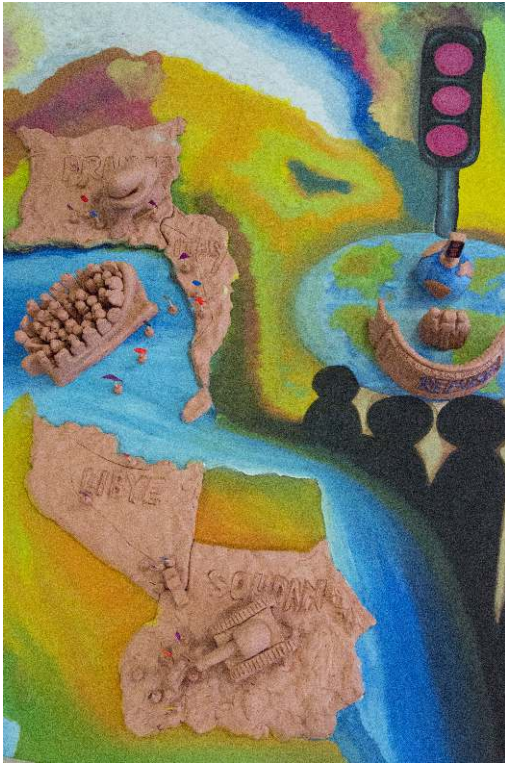
Figure 7. « The world is stopping us/Le monde nous empêche d'avancer ». Vue 1