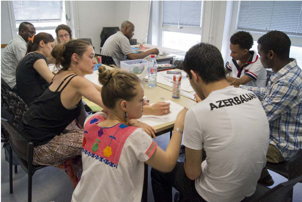
Figure 1. Séance d'atelier